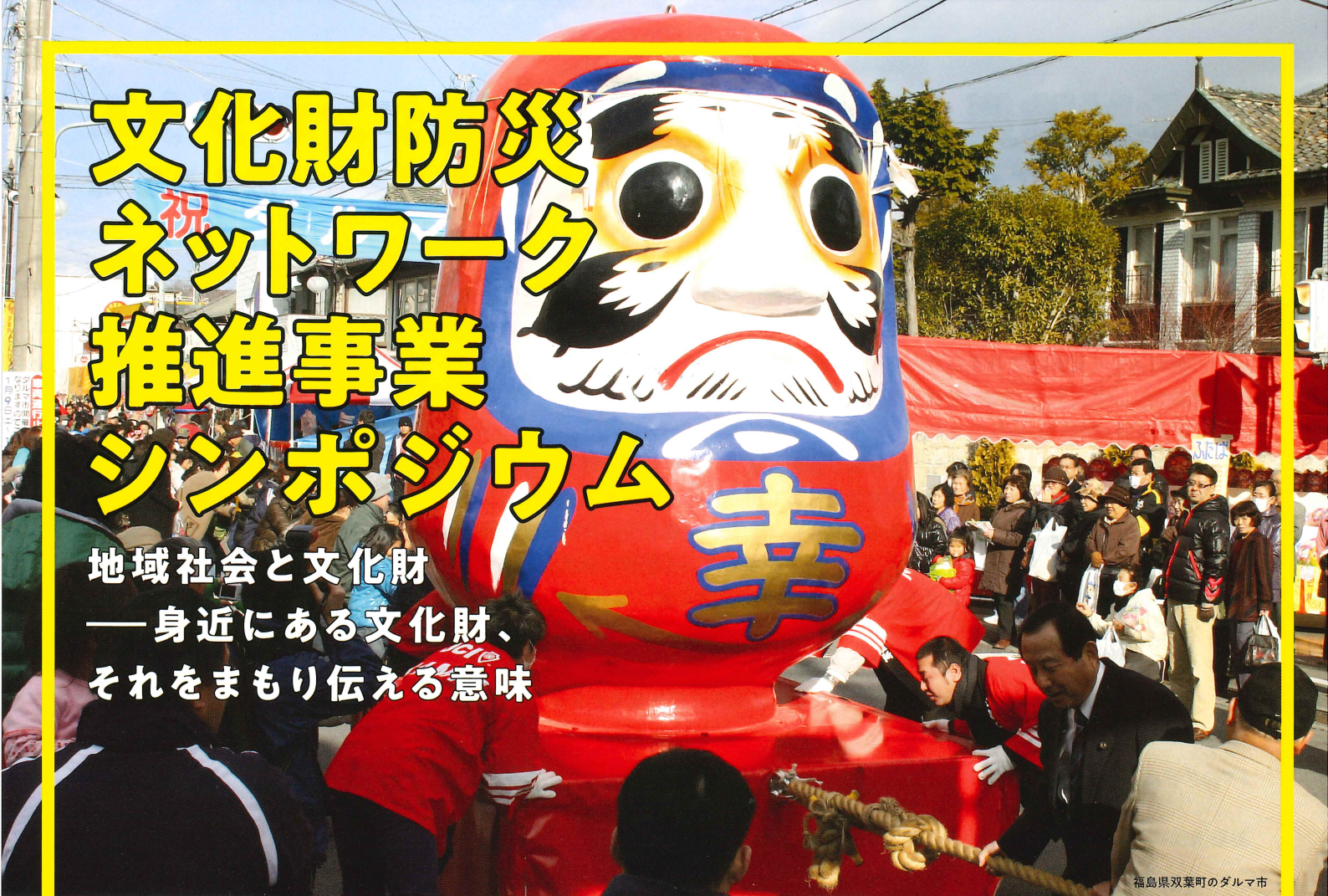
福島県双葉町のダルマ市