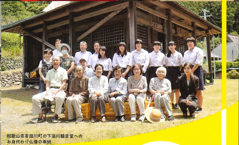
和歌山県有田川町の下湯川観音堂へ お身代わり仏像の奉納