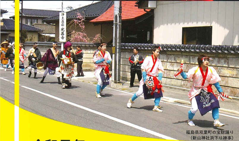
福島県双葉町の宝財踊り (新山神社浜下り神事)