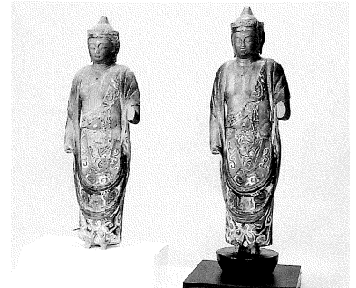
和歌山県有田川町の下湯川観音堂の観音菩薩立像(左)とそのお身代わり仏像(右)

○台東区循環バス「東西めぐりん」:「上野駅入谷口」バス停から谷中・千駄木 方面(寛永寺経由)のバスに乗りし、1つ目のバス停が東京国立博物館前(4分)。