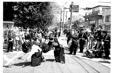
福島県双葉町の新山の神楽(新山神社浜下り神事)