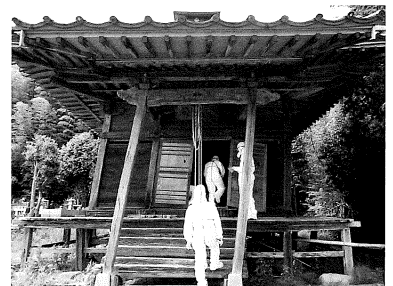
福島県双葉町における文化財救出活動