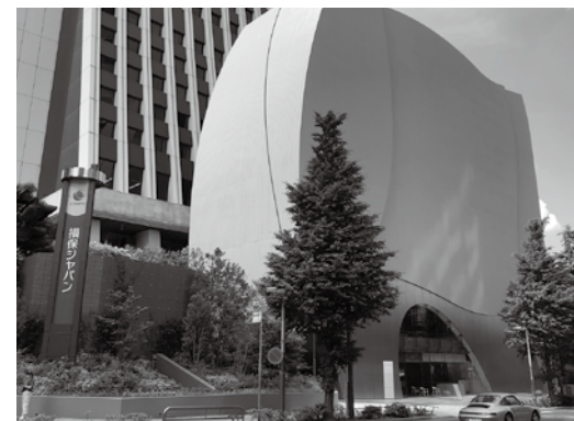
SOMPO 美術館外観