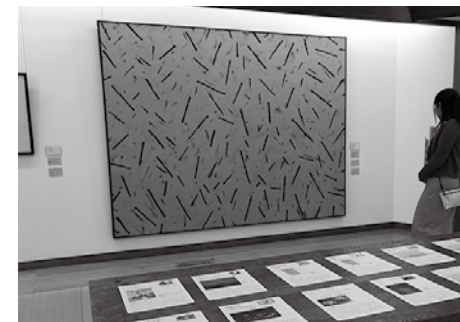
坂本善三美術館「おいしいもので作る善三展」会場風景