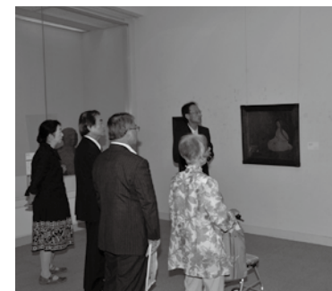
天童市美術館「石川確治展」会場風景