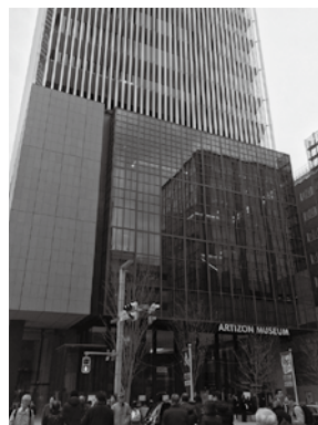
石橋財団アーティゾン美術館外観