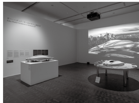
国立国際美術館「インボッシブル・アーキテクチャー 建築家たちの夢」展 ザハ・ハジド・アーキテツク+設計JV(新国立競技場)案(2013-2015) 手前模型：設計JV構造用風洞実験模型(1/300、2点とも) 奥CG画像：ザハ・ハジド・アーキテツク

この対談が実施されてから2ヶ月余が経過し、磯崎氏が発言していた世界が現実的なものとして目の前に広がっている現状に大きな驚きを感じるともに、「パンデミック・シティ」のような緊急時に於ける美術館の在り方といったものを今後は考えていく必要性が生じてくることも実感している。一つの展示会の中止という限定的な問題から大きく離れ、今後の美術館の在り方を考える必然性が生じて来ることを磯崎氏は見越してこのようなテーマを持ち出したのかもしれない。