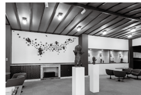
《2000年後の温泉遺跡 | PLANET REMAINS》 柴川敏之 「湯郷温泉 かつらぎ」