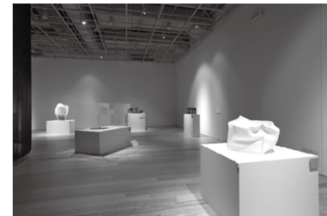
富山市ガラス美術館 「富山ガラス大賞展 2018」会場風景