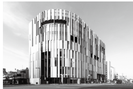
富山市ガラス美術館が入る TOYAMA キラリ 外観

ここまで、北陸の応用美術、特にガラス分野での国際的な情報発信と交流について述べてきた。ただし、21世紀に入って既に20年を経た現在、芸術性を追求する純粋美術と実用性を追求する応用美術という分類は、ほとんど意味をなさなくなっている。むしろ、20世紀半ばから、従来の応用美術、特に陶芸やガラスを含む現代工芸の分野で、美術の領域への越境が果敢に繰り返されてきたことが注目される。北陸のガラスもこうした潮流に掉さしていて、その動向から一瞬も目が離せない。