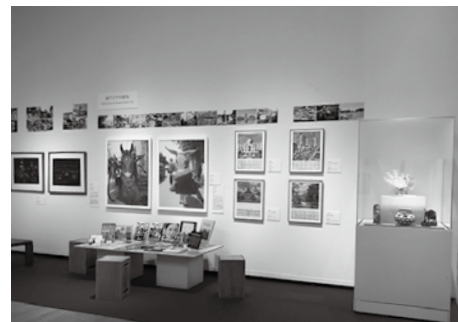
福岡アジア美術館「福岡アジア美術館 開館20周年記念展 アジア美術、100年の旅」。南アジアの街角コーナー

九州の美術館を見ていて感じるのは、人々と美術館との心理的な距離の近さだ。その関係性の中で生まれる様々な活動をこの場で全て紹介できないのは残念である。この誌面が発行される時コロナ禍から抜け出ているのかはわからないが、収束したときには、再び人々と美術館をつなぐ、しかも新しい活動が生まれていることと確信する。