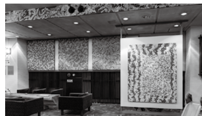
左から 《symbol No.2》《symbol No.3》《symbol No.1》《紅白景》 児玉知己 湯原温泉宿「湯快感 花やしき」