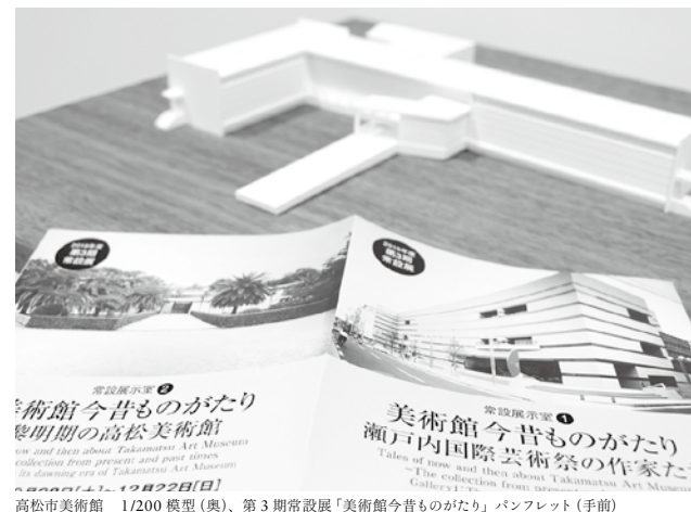
高松市美術館 1/200 模型(奥)、第3期常設展「美術館今昔ものがたり」パンフレット(手前)

展覧会以外では、2020年2月10日、丸亀市猪熊弦一郎現代美術館(以下、MIMOCA)と一般財団法人地域創造共催で、片山泰輔(静岡文化芸術大学教授)と貝塚健(石橋財団アーティゾン美術館)が講義に当たった「美術館出前(オーダーメイド)型ゼミ」の開催。詳細は割愛するが、「ミュージアムに関わる様々な立場の職員(学芸員、総務課職員、所管部局職員等)の相互理解を図り、自館の課題を見つめなおし、これからの活動をどのような理念のもと行っていくべきかについて、関係者が一丸となって共有することを目的」とした本ゼミの企画発案者の一人が、子ども時分よりMIMOCAに親しんだ若手の丸亀市行政職員だと知り、美術館の存在意義を教えられたように感じた。もうコロナ禍前には戻れないが、リニューアルオープンが延期されているMIMOCAや各美術館の再開に向けて、「美術館は心の病院」という言葉を残した猪熊や、焼け野原に美術の力を夢見た明石のようにありたいと思う。