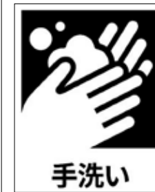
厚生労働省の感染予防対策ビジュアル集(フリー素材)より「手洗い」

これまでもいまま、信じがたい事態は、館を訪れ、作品・資料に触れる営為を直撃し、これからも、人・モノ・コト・場の距離を分かち違いない。インフラや公共交通の世界も同様である。それでもなお、幸いなことに中の人には、護り、つなぎ続ける使命があり、時代と状況に即したアイディアで、いつでも距離を縮めることができる。