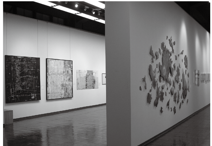
市立小樽美術館「開館40周年記念特別展 III 小樽・美術家の現在シリーズテーマ展『風土』」会場風景

終わりに、この原稿を書いている間にも各美術館は色々な対応に追われているだろう。中止や延期が視野に入る展覧会もあるだろう。当館も、今まさにその渦中にある。各種の講演会、シンポジウム、解説その他中止となった事業も多い。それはそれでやむをえないが、中止や延期の対応が一区切りしたならば、頭の中をリセットして、地元の現代作家や所蔵品という基本に立ち戻り、研究を深め、改めて掘り起こしを考えてみる良い機会としたいものである。いざとなれば意外と面白い発想が出てくるかも・・・と楽観している。