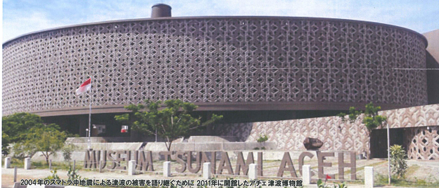
2004年のスマトラ沖地震による津波の被害を語り継ぐために 2011年に開館したアチエ 津波博物館